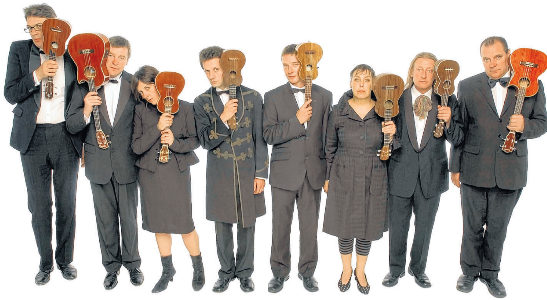
Musikalisch und optisch ein Genuss: „The Ukulele Orchestra of Great Britain“ sind am 20. August mit ihren Ukulelen in der MuK in Lübeck zu bestaunen.