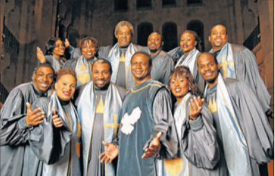
„The Very Best of Black Gospel“.

„The Very Best of Black Gospel“: Die Gospelsensation aus den USA ist wieder auf Europatournee und kommt dabei am 6. Januar um 19,30 Uhr ins Kolosseum nach Lübeck. Bei diesem Ensemble ist es erstmals gelungen, eine Auswahl der besten Gospelsänger und Sängerinnen aus den USA