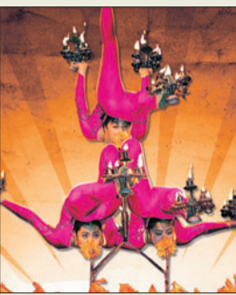
Die Akrobatik der Artisten ist atemberaubend.

Zirkus vom Feinsten: Der Chinesische Nationalcircus tourt bereits seit 1989 sehr erfolgreich mit innovativen, außergewöhnlichen und stetig neuen Programmen über den europäischen Kontinent.